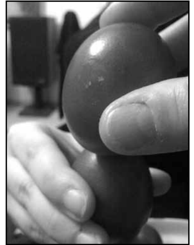
следующего Великого поста.

Поэтому получается, что мы одновременно празднуем два праздника: одно, как великое событие Воскрешения Христова, а второе – дань великому циклу рождения и смерти, дань плодородию. В православии много таких совпадений. Например, масленица – исключительно языческий праздник, который был сохранен и втиснут в рамки православных празднеств и по-