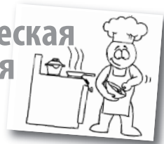
Рис с медом

Ингредиенты: Рис 50гр., изюм, цукаты 20гр., мед 30гр., орехи или ядра семечек 10гр., варенье 30гр.