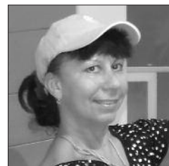
MARINA BENT РЕΚΛΑΜΝΥЙ ΟΤΔΕΛ