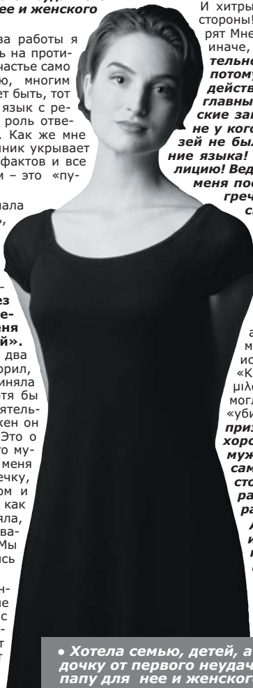
• Хотела семью, детей, а так как уже имела дочку от первого неудачного брака, хотела папу для нее и женского счастья для себя.