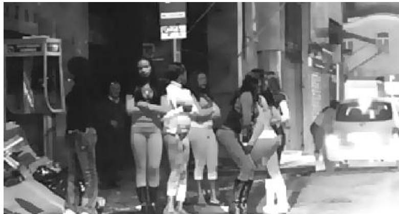
Οι Αφρικανοί φαίνεται να ελέγχουν ολοκληρωτικά το τρίγωνο Αγίου Κωνσταντίνου, Μάρνη, Πατησίων