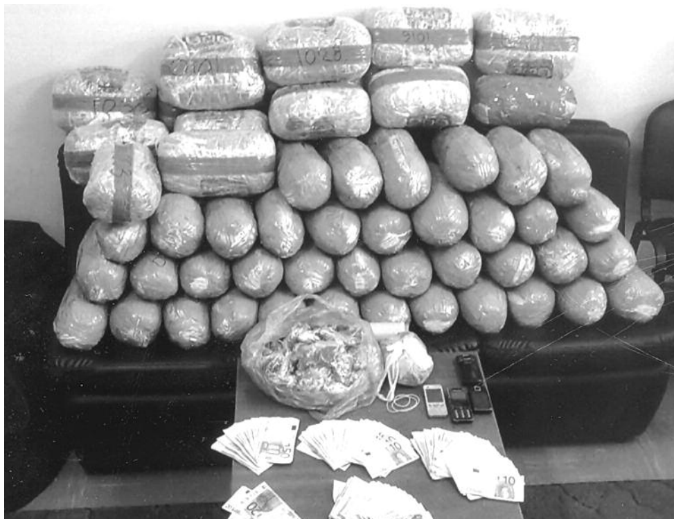
Η μεγάλη ποσότητα ινδικής κάνναβης και τ' άλλα κατασχεμένα από τους Αστυνομικούς της Ασφάλειας Καμινίων – Πειραιώς