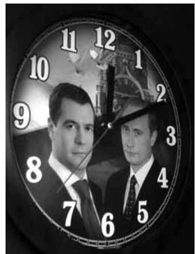
Αντίστροφα μετρά ο χρόνος για την εναλλαγή Πούτιν-Μεντβέντεφ στο Κρεμλίνο

Οι περισσότεροι διερωτώνται πώς μπορεί να επιστρέψει στην εξουσία κάποιος που δεν έφυγε ποτέ;