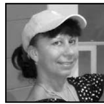
Μπεντ Μαρίνα Υπευθ. Εμπορικού