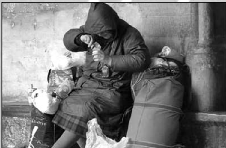
Αν και δεν μπορεί να προσδιοριστεί με ακρίβεια ο αριθμός των