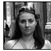
Σαπουντζή Γιάννα Art design